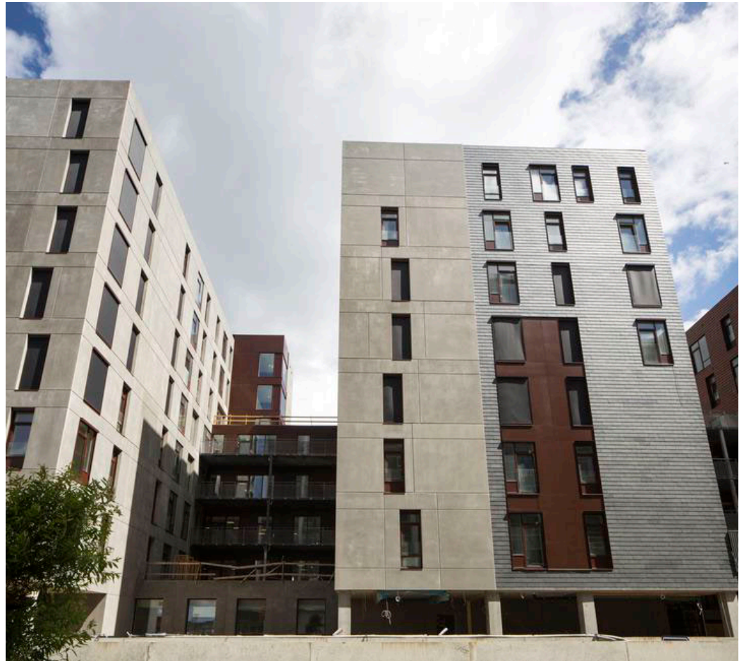
Det nyopførte Generationernes Hus i Aarhus, tegnet af Erik Arkitekter, indeholder både familieboliger, ungdomsboliger, daginstitution, ældreboliger og plejeboliger samt kreative værksteder, atelier og pædagogiske 'laboratorier'.

»Idéen om lave et nordisk manifest, hvor man diskuterer arkitekturens rolle i en opbyrningstid, er rigtig god. Arkitektur har et globalt sigte, hvor mange opkommende lande arbejder med projekter, der forsøger at udnytte de nye teknologier. I mange af de lande har man behov for at bygge mange boliger til mange mennesker hurtigt, og det sætter store krav til alle, der arbejder med formgivning og planlægning. Det giver nye måder at se på vores liv og vores rammer – det er ikke blot tag over hovedet. Det omfatter alt det